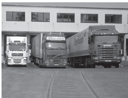
Abb. 2: Auch Güterströme über die Grenzen von Bundesländern, Mitgliedsstaaten und Kontrollstellen hinweg müssen überwacht werden.

Die gesamte Wertschöpfungskette im biologischen Landbau unterliegt umfangreichen Regelungen, die von Behörden mehrfach überwacht werden. Zum Teil werden auf Grund spezifischer Gegebenheiten Produzenten, Aufbereiter oder Importeure, die nach VO 2092/91 zu kontrollieren sind, von verschiedenen akkreditierten Kontrollstellen, verschiedenen nicht akkreditierten privatrechtlich agierenden Kontrollorganisationen (z. B. Tierschutzorganisationen) und von verschiedenen Behörden (z. B. Amtstierärzte, Gewerbebehörde) gleichzeitig bzw. in sehr kurz aufeinander folgenden Intervallen mehrfach auf ein und dieselben Bestimmungen kontrolliert.