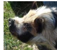
Abb. 2: Der Biolandbau kann viel zum Erhalt der Biodiversität und zur direkten Kommunikation mit Konsumentinnen beitragen