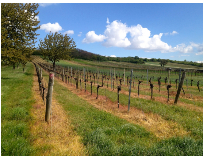
Die gelben Spuren verraten, dass hier Pestizide ausgebracht wurden. Wo gespritzt wurde, wächst kein Gras mehr

A cker-Senf, Hahnenfuß und Hirtentäschelkraut, die Vogelmiere, die man in Wildkräuterkochbüchern findet, Kamille und Weidenröschen, die man als Tee kaufen kann. Sie alle haben eines gemeinsam: Pflanzenschutzhersteller stufen diese Pflanzen als sehr gut bekämpfbar ein.