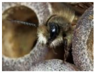
Wildbiene zwischen Bambusrohren