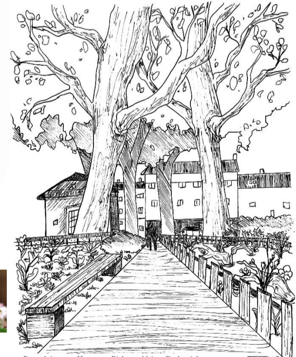
Perspektive vom Hauptweg Richtung kleines Backsteinhaus