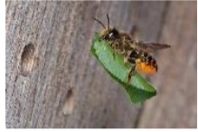
Blattschneiderbiene während des Anfluges auf ein Brutloch