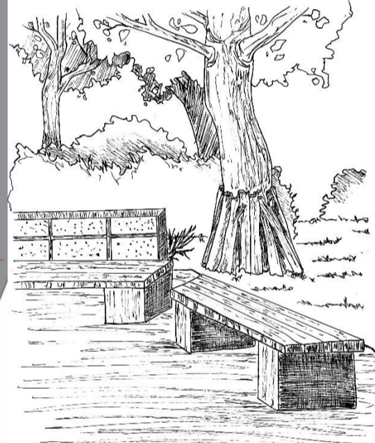
Perspektive von Sitzgelegenheiten mit einer Lehneand und Totholz