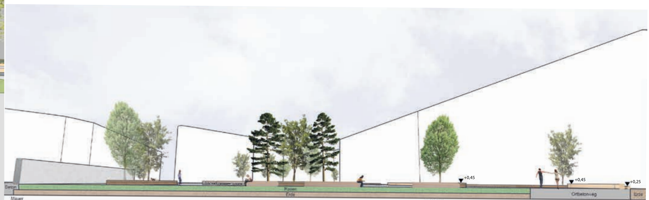
SNITTANSICHT B - B' 1:250