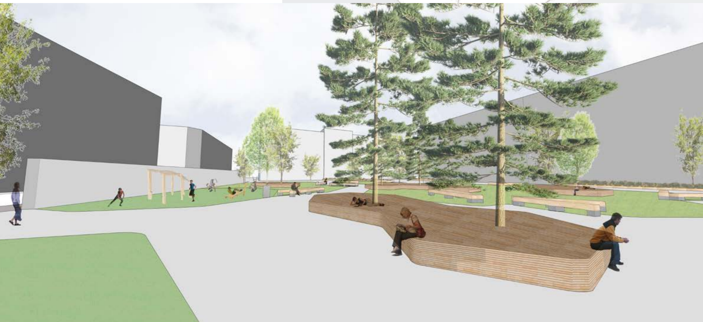
PERSPEKTIVE VOM KINDERGARTEN IN RICHTUNG RESTAURANT PLATO VIENNA

DIE NEU GESCHAFFENEN FLÄCHEN ERINNERN AN DEN GRUNDRISS EINER KIEFER UND SOLLEN EINEN KIEFERNWALD DARSTELLEN. ALS SITZMÖGLICHKEITEN GIBT ES HOLZBÄNKE IN FORM VON NADELN, SOWIE HOLZDECKS, WELCHE ALS LIEGEFLÄCHE GENUTZT WERDEN KÖNNEN. DIE VERWENDETEN MATERIALIEN UND DIE GRÜNE VEGETATION SOLLEN EINEN NATURRAUM IN DER STADT DARSTELLEN. DIE MAUERN SCHIRMEN DEN LÄRM DER ANGRENZENDEN STRASSE AB UND DER PARK WIRD ZU EINEM RUHIGEN UND ENTSCHEUNIGTEN ORT. ENTLANG DER MAUER BEFINDEN SICH ZWEI EPDM FÄCHEN FÜR SPORT- BZW. SPIELMÖGLICHKEITEN. DER HAUPTWEG FÜR DEN DURCHGANG BLEIBT BESTEHEN UND WIRD DURCH STAUDENBEETE UND SITZMÖGLICHKEITEN BEGLEITET. DER GRÖSSTE TEIL DES PARKS IST WIESE, WELCHE MULTIFUNKTIONAL GENUTZT WERDEN KANN. DIE MULTIFUNKTIONALE WIESE IST FÜR SPORT, SPIEL UND ENTSPANNUNG GEEIGNET.