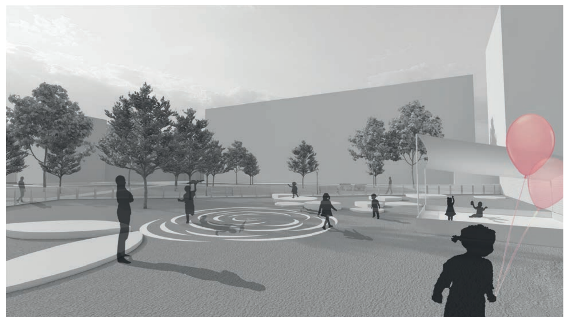
PERSPEKTIVE ÜBER DEN PARK AUS NORD-ÖSTLICHER SICHT

TRANSPARENT) DURCHFÜHRT, WODURCH EINE POSITIVE BAUMBILANZ ENTSTEHT. ZU DEN WEISSEN ROSEN WERDEN LAVENDEL, ANEMONEN UND FETTHENNEN GEPFLANZT, UM DAS ERSCHEINUNGSBILD ABZURUNDEN. DER ANGELEGTE SCHOTTERASEN SOLL BEI FEUERWEHREINSÄTZEN DIE ZUFAHRT MIT EINSATZFahrzeugen GEGEWÄHRLEISTEN. ALS BESONDERHEIT BEIM SPIELPLATZ WURDE DIE DRAUFSICHT EINER ROSE AUS TERRAWAY GEPLANT. VON IHR AUS GIBT ES STEINPLATTEN IN FORM VON WEGFLIEGENDEN BLÜTENBLÄTTER, DIE UNTERSCHIEDLICH HOCH AUS DEM RASEN HERVORRAGEN UND SO ZU SPIELGERÄTEN WERDEN. IM NEUBAU WÄRE EIN KLEINES GEMEINSCHAFTS-CAFÉ ANGEDACHT, WELCHES ABER NUR ALS VORSCHLAG FÜR DEN ARCHITECTEN SEIN SOLL.