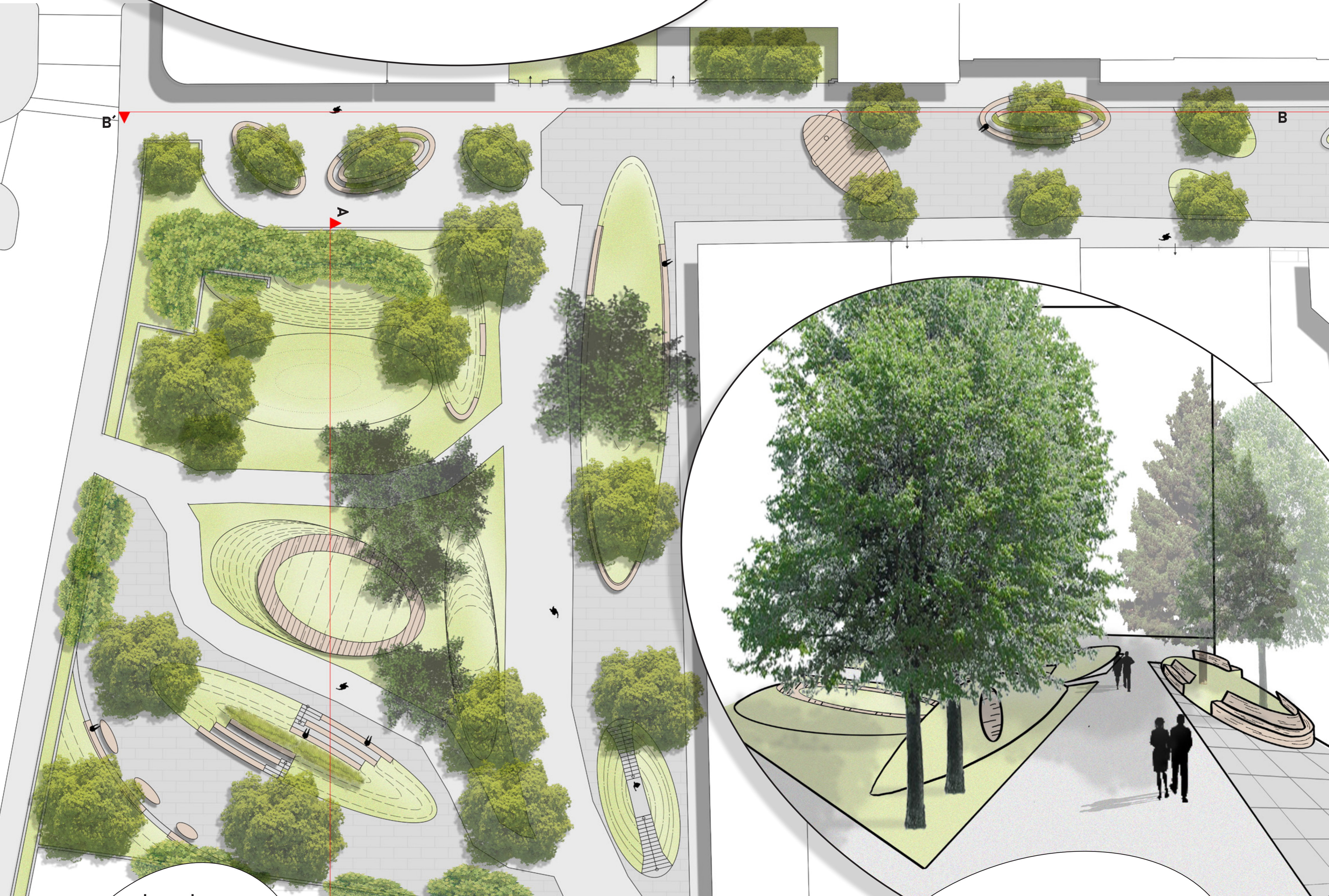
Grundriss M 1:200