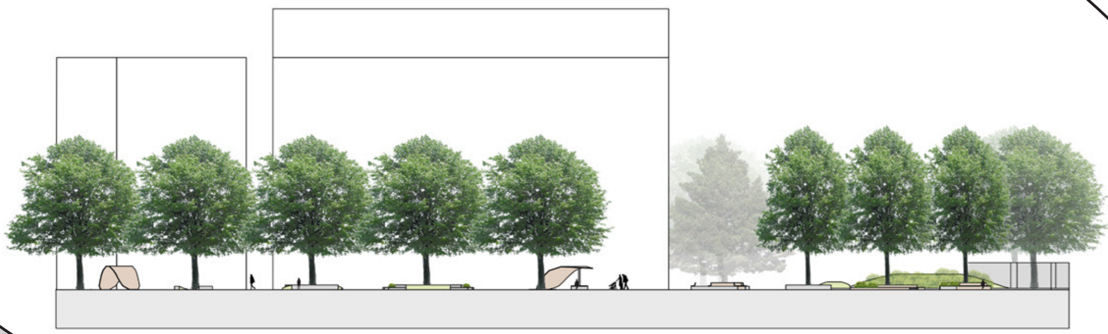
Schnittansicht B-B' M 1:500