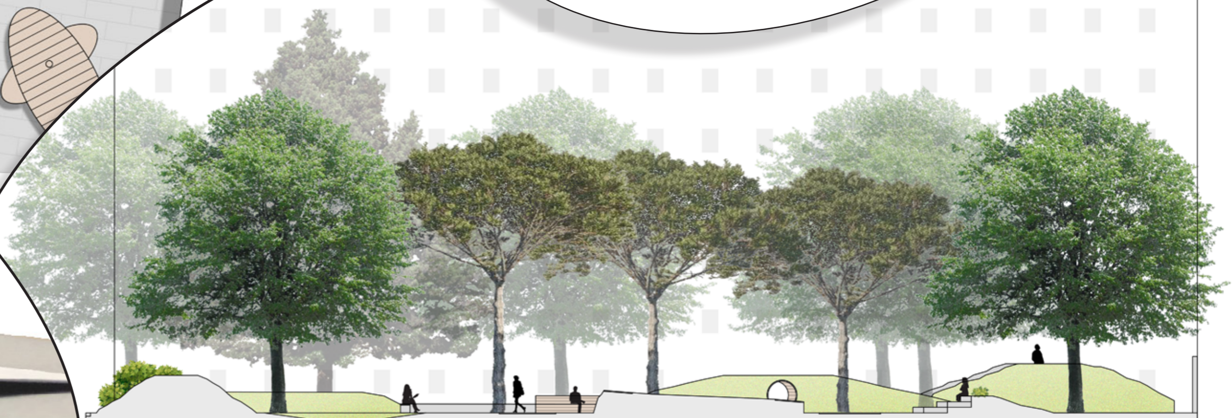
Schnittansicht A-A' M 1:200