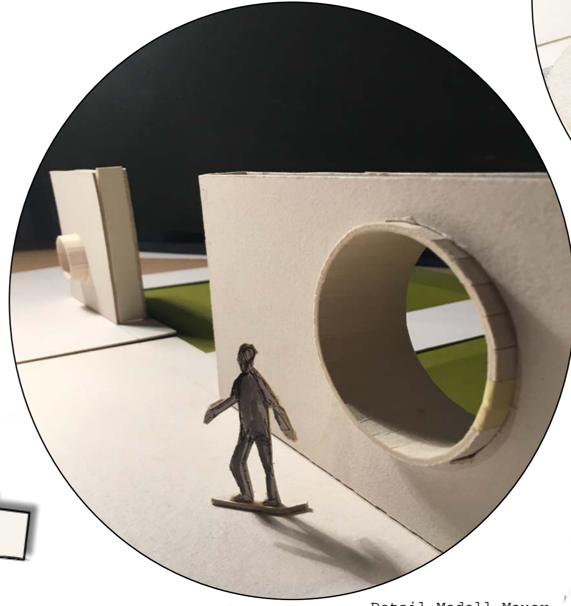
Detail Modell Mauer