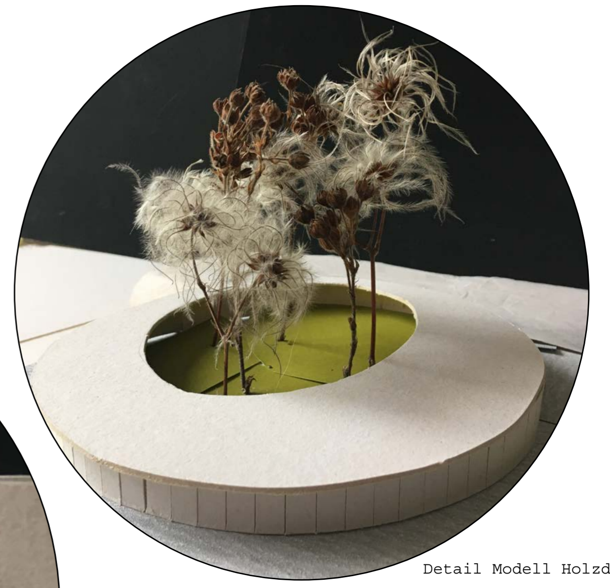
Detail Modell Holzdeck

Durch das Auflösen der Mauer und dem zusätzlichen Gewinn an Platz soll der Ignaz-Kuranda-Park eine klare und einladende Atmosphäre schaffen. Auf der neu gewonnenen Fläche bieten Holzdecks mit Bepflanzung einen Ort zum Ausruhen und Entspannen. Die Mauerstücke dienen nicht nur als angedeutete Raumgrenze, sondern ebenfalls als Aufenthaltsort.