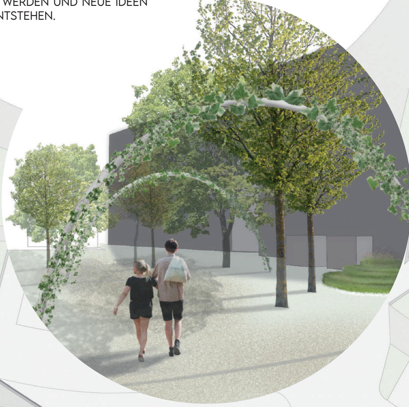
DURCH DAS KIPPEN DES WIRBELSTURMS IM 90° WINKEL BILDEN SICH BOGENFÖRMIGE WÖBLUNGEN, DIE AUS DEM BODEN HERAUSRAGEN