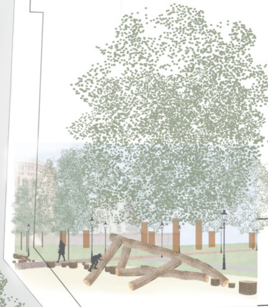
Perspektive Spielplatz 'Fußstapfen' Blickrichtung Gasometer / Villa Verdi