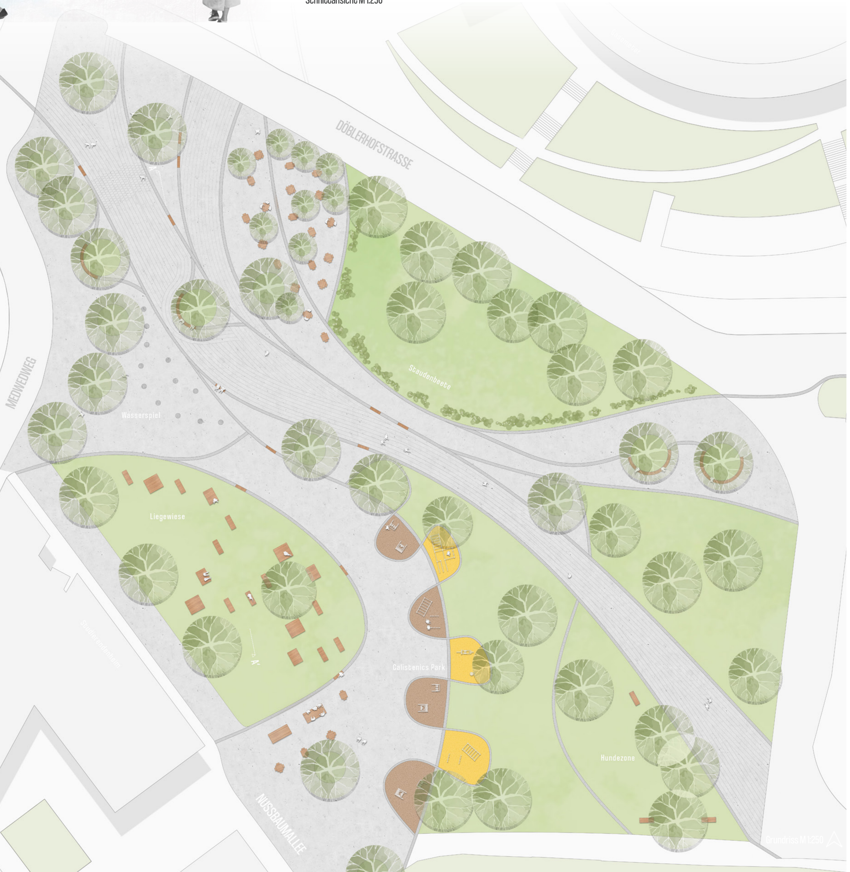
Grundriss M 1:250

Achillea filipendulina Anthemis tinctoria Coreopsis grandiflora Doronicum caucasicum orientale Helenium hoopesii Oenothera fruticosa Dianthus caryophyllus Erysimum allionii Euphorbia polychroma Gaillardia aristata Geum hybridum Lysimachia punctata Potentilla megalantha Scabiosa ochroleuca Solidago virginica Telekia speciosa Trollius chinensis