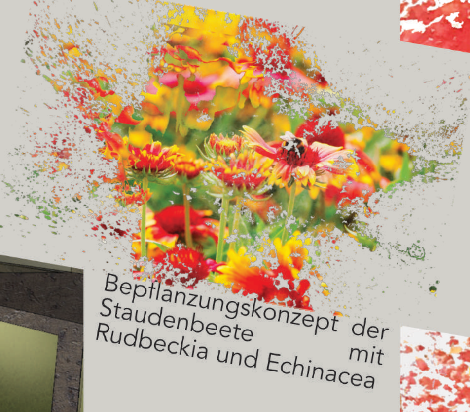
Bepflanzungskonzept der Staudenbeete mit Rudbeckia und Echinacea