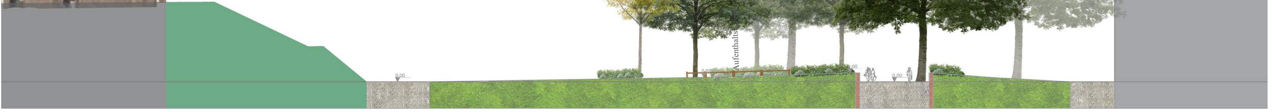
Schnitt AA' M 1:250