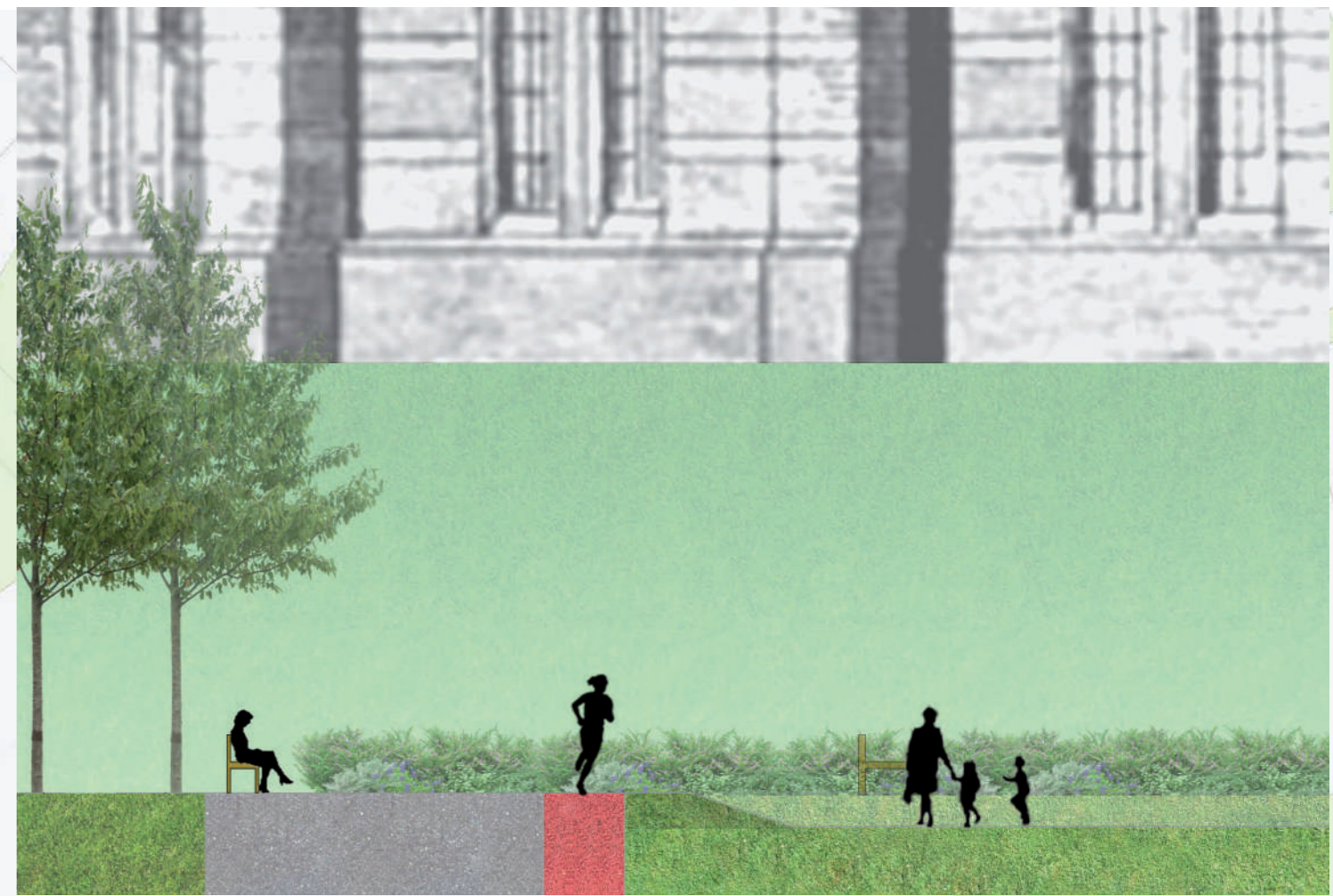
Schnitt B-B' M1:100