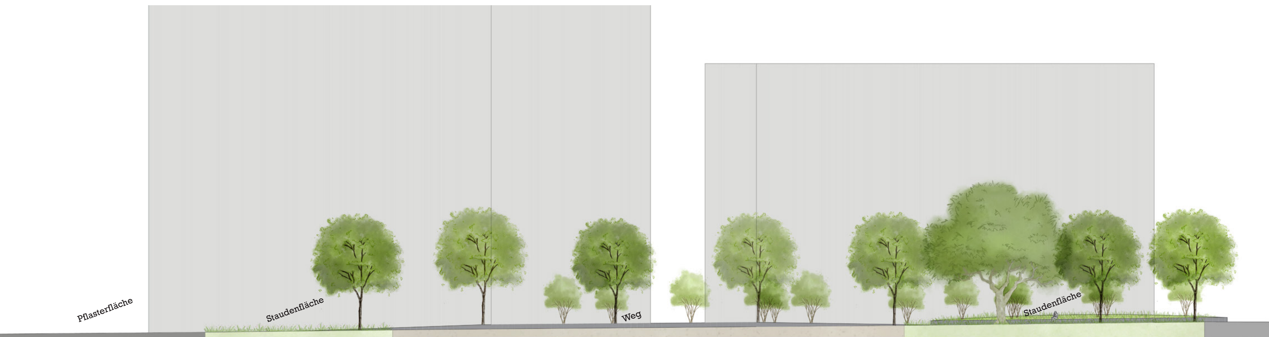
Schnittansicht A-A' M 1:250