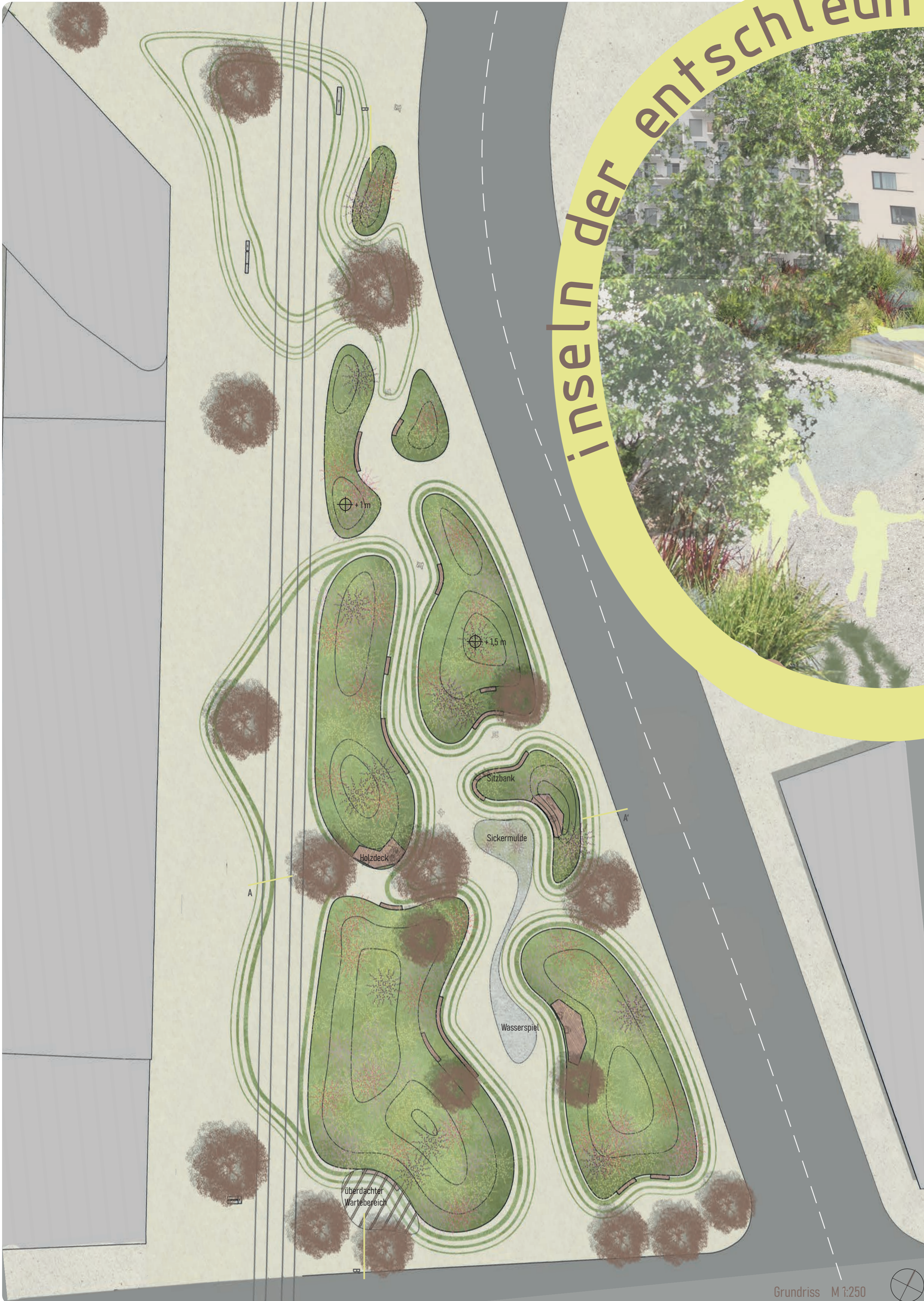
Grundriss M 1:250