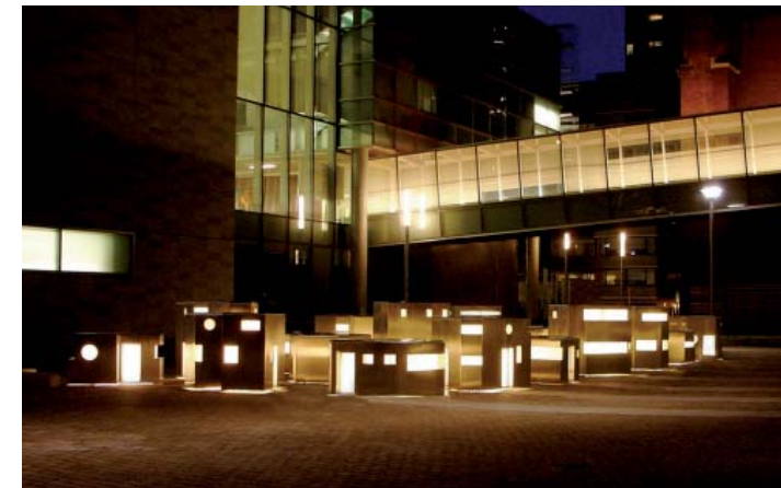
RadioCity (Landscape Proposals for publicly accessible private plaza and outdoor amenity space)