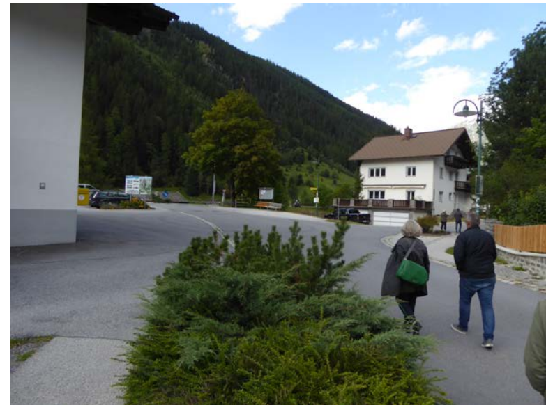
Studierenden- und JungabsolventInnenwettbewerb Feichten im Kautertal