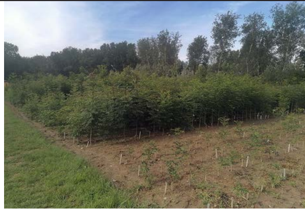
Klonarchiv der ausgewählten und gepfropften Eschen-Klone im Versuchsgarten (im Hintergrund), im Vordergrund sind über Stecklinge vermehrte Jungpflanzen derselben Klone erkennbar.

Im Herbst 2024, zum Abschluss der Phase II von „Esche in Not“, wird die Hochlagen-Plantage in Kooperation mit dem Landesforstgarten Tirol bei Nörsach angelegt werden. Mit ersten ertragreichen Saatguternten ist in etwa 10 Jahren zu rechnen. Zusätzlich werden mit den erzeugten Stecklingspflanzen Versuchsflächen auf Waldstandorten angelegt. Die erste Fläche wurde bereits im Herbst 2023 in Kooperation mit der Landesforstdirektion Oberösterreich bei Asten etabliert. Dort soll an einem Waldstandort unter hohem Infektionsdruck die hohe Krankheitstoleranz der ausgewählten Klone überprüft werden, um die Klonauswahl zu optimieren. Darüber hinaus wurden im Projekt „Esche in Not“ künstliche Infektionsversuche mit dem Eschentriebsterben-Erreger (durchgeführt vom IFFF der BOKU