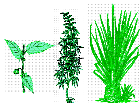
Verschiedene faserproduzierende Pflanzen