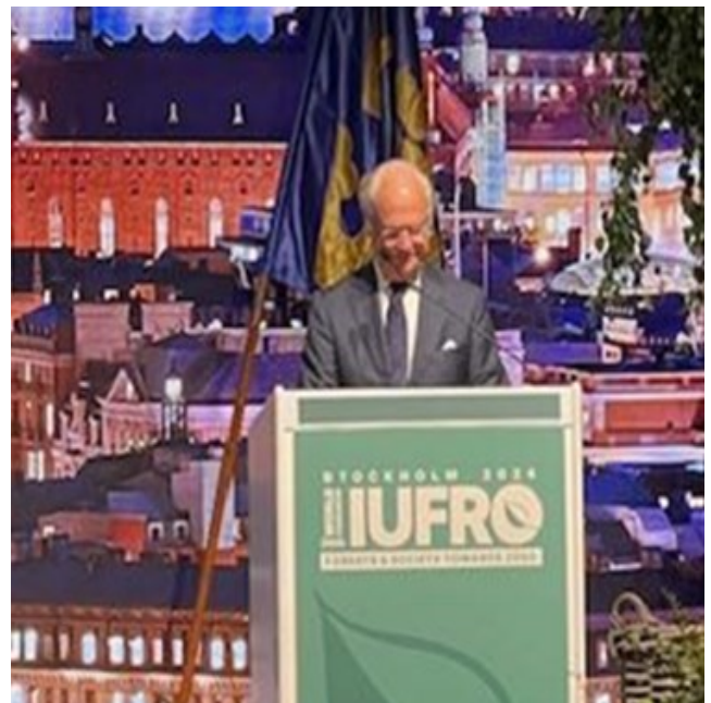
Eröffnungsrede des Königs von Schweden, Carl Gustaf XVI