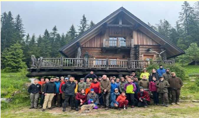
Foto: BOKU Studierende der Waldbauexkursion. Juni 2024 im Forstbetrieb Hainzl bzw. Windheimat, Steiermark

Unser Waldbauinstitut war mit 10 Personen beim Weltkongress und mit einigen Vorträgen und Postern bestens vertreten. Viele ehemalige Mitarbeiterinnen und Mitarbeiter wurden getroffen und mit vielen Kolleg*innen konnten die bestehenden Kontakte vertieft und neue geknüpft werden. Besonders erwähnt seien die hervorragenden Präsentationen unserer jungen Mitarbeiterinnen und Mitarbeiter, die mit viel Freude und Begeisterung erstmals an einem IUFRO Weltkongress teilgenommen haben.