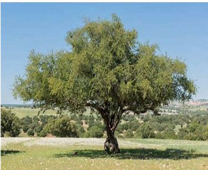
Beispiel eines Arganbaumes in Marokko