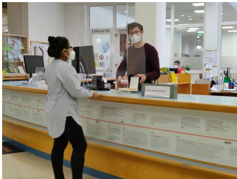
Entlehnsservice unter Einhaltung der Corona-Maßnahmen