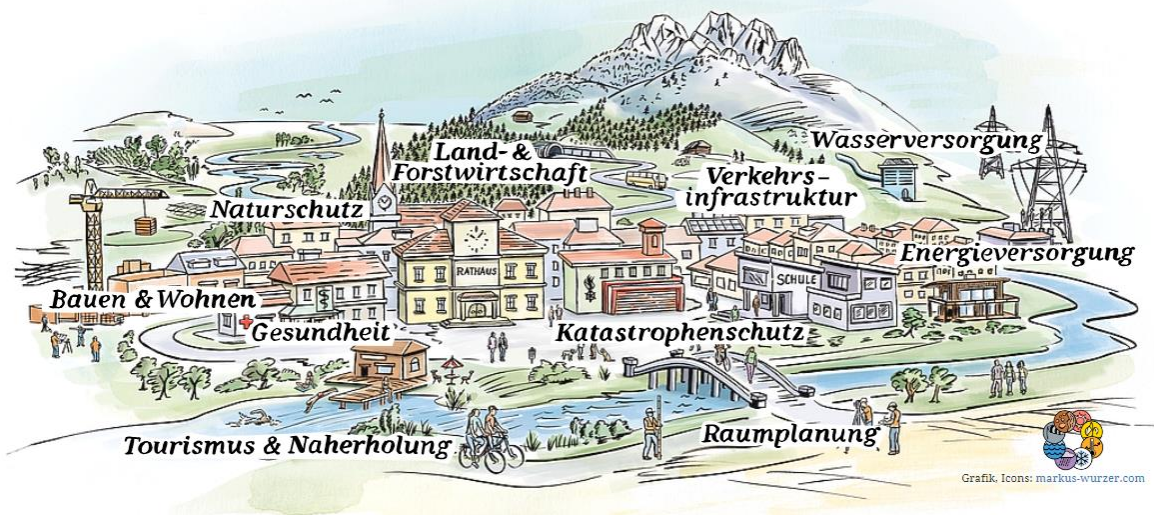
Grafik. Icons: markus-wurzer.com