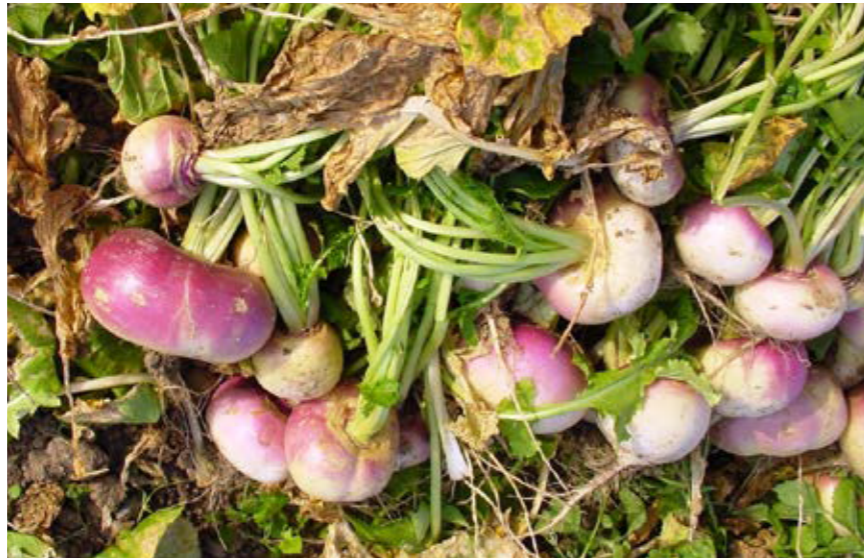
Lokale Sorte der Speiserübe, die schon schon seit Generationen in Assling (Osttirol) vermehrt wird.

Arbeitsgruppe Wissenssysteme und Innovationen, Institut für Ökologischen Landbau, Department für Nachhaltige Agrarsysteme, Universität für Bodenkultur (BOKU) Gregor-Mendel-Straße 33, A-1180 Wien