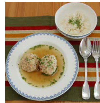
Das Rübenkraut wird heute meist als Beilage zu den Tiroler Knödeln verwendet.