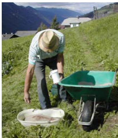
Das Saatgut wird mit trockenem Sand vermischt (Assling, Osttirol).

würden sich gegenseitig im Wachstum behindern. Um dies zu vermeiden, kamen mehrere Techniken zum Einsatz. Das Saatgut wurde vor dem Aussäen mit trockenem Sand (wobei „mehr Sand als Samen“ verwendet werden soll), Steinmehl oder auch Erde vermischt. Das Verhältnis von Sand und Saatgut wurde von einer Gesprächspartnerin mit einem Teil Samen und fünf Teilen Sand angegeben. Ein anderer Gesprächspartner brauchte für ¼ Liter Rübensamen 20 Liter Sand. Diese Mischung sollte das dünne und gleichmäßigere, händische Aussäen der Speiserüben erleichtern. Nach der erfolgten Aussaat wurde das Saatgut mit der Egge oberflächlich eingearbeitet und angewalzt.