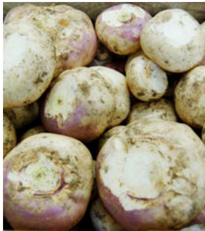
Geputzte Rüben, bevor sie in die Waschanlage kommen. (Assling, Osttirol). Bildarchiv Brigitte Vogl-Lukasser, 2010.

die ganzen Rüben. Dafür wurden die Rüben gewaschen, geputzt (Wurzel, Stängel und Blätter entfernt, manchmal auch geschält) und kurz in Salzwasser gekocht. Die gekochten, ganzen Rüben wurden dann abwechselnd mit einer Lage Kren in einen großen Tontopf geschichtet und mit einem Tuch und einem Deckel zugedeckt.