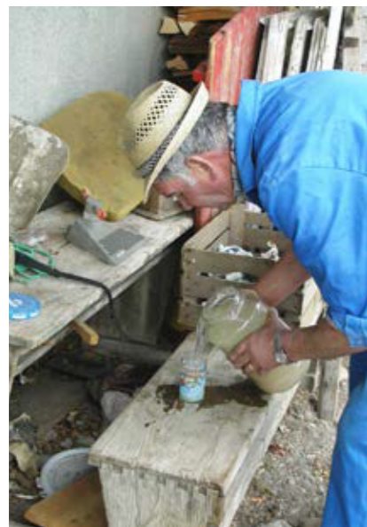
Der Saft der eingesäuerten Rüben wird abgeschöpft und als Trinkkur verwendet (Assling, Osttirol).

Alle unsere Ausführungen basieren auf teilstrukturierten qualitativen Interviews mit GesprächspartnerInnen in Osttirol aus den Jahren 1998 (Vogl-Lukasser, B. 1999) und 2005 (Vogl-Lukasser et al., 2006), die im Rahmen von Forschungsprojekten im Auftrag des BMLF, BMWF und des Landes Tirol durchgeführt worden waren. Bilder und weitere Gespräche wurden laufend bis in das Jahr 2019 angefertigt bzw. durchgeführt. Wir danken den GesprächspartnerInnen, insbesondere aber der Familie Bachmann aus Assling, ganz herzlich für ihre Erfahrungsberichte über den Rübenaubau. Alle als wörtliche Zitate gekennzeichneten Textstellen stellen Aussagen der GesprächspartnerInnen dar, die wir zu dem Thema befragt haben.