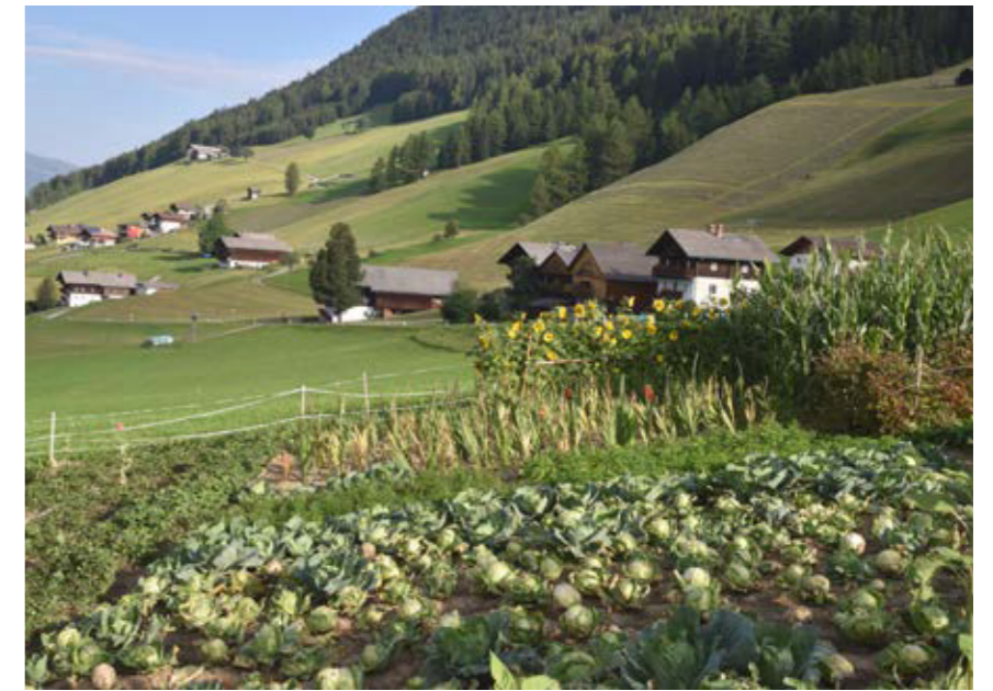
Einen „ Kobisocko “ (Krautacker) gibt es heute nur mehr auf wenigen landwirtschaftlichen Betrieben (Kartitsch, Osttirol).

In der Nähe der Gebäude der Hofstelle befand sich meist auch ein Kobisackole (kleiner Krautacker), der manchmal auch als Kobisgorte (Krautgarten) bezeichnet wurde. Zum Unterschied zu den vorher genannten „Gärten“ war dieser Bereich nicht eingezäunt. Das Fehlen des Zaunes begrün-