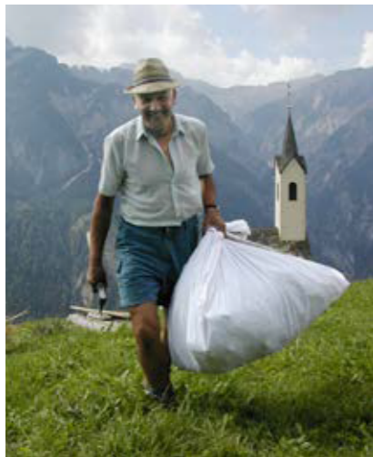
In einem Bündel wird das wertvolle Erntegut – die Samenstände der Rübe – nach Hause transportiert, um dieses zur Trocknung luftig, warm und trocken aufzuhängen (Assling, Osttirol). Bildarchiv Christian R. Vogl, 2002.