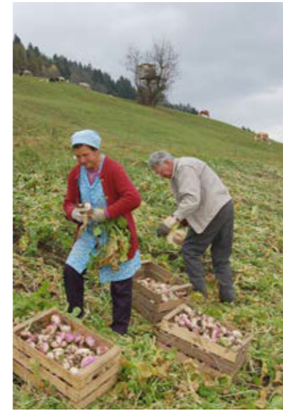
Bei der Ernte der Speiserübe zieht eine Person die Rüben heraus, die zweite Person entfernt die Blätter und schichtet die Rüben in die Holzkiste (Assling, Osttirol). Bildarchiv Christian R. Vogl, 2010.

Verarbeitet wurden die Rüben bei jenen GesprächspartnerInnen, die Speiserüben zuletzt noch großflächig anbauten, ausschließlich zu Rübenkraut. Entscheidend für die Produktion eines guten Rübenkrautes sei die Qualität der Rüben selber und das saubere Putzen vor der Verarbeitung. Beim händischen Putzen wurden Wurzel, Blattgrund bzw. Blattstiel und wurmstichige Bereiche der Rübe großflächig mit einem Messer entfernt. Im Anschluss daran wurden die Rüben sauber gewaschen. Bei kleineren Mengen hat man das Waschen händisch im Wassertrog mit einer Bürste durchgeführt und im Anschluss die Rüben händisch zerkleinert, im Fleischwolf gehäckselt und in Ton-Gärtöpfen oder kleinen Plastikkübeln eingestampft und luftdicht verschlossen. Bei größeren Mengen kam zum Waschen eine Apfelwaschmaschine zum Einsatz, und die grobe Zerkleinerung wurde von einem Rübenhäcksler („ Runkelmaschine “) erledigt. Diese grob gehäckselten Teile wurden dann in einem großen Fleischwolf auf Reiskorngröße faschiert und ohne den Zusatz von Salz oder anderen Stoffen in Plastikfässer leicht eingestampft, bis sie mit der beim Stampfen austretenden Flüssigkeit gut bedeckt sind. Um die Gärung in Schwung