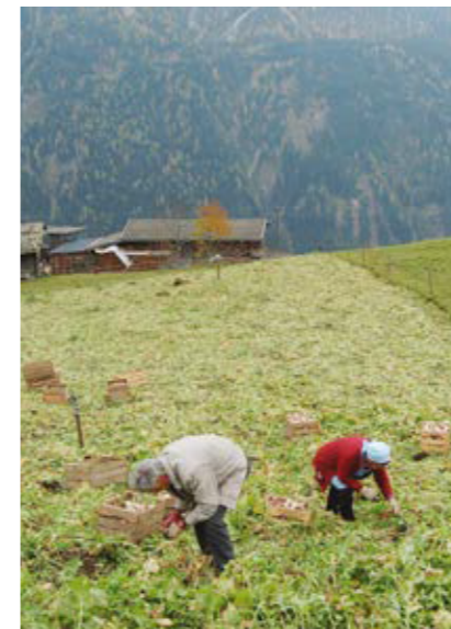
Die abgedrehten Blätter bleiben auf dem Acker liegen (Assling, Osttirol). Bildarchiv Christian R. Vogl, 2010.

zu bringen, wurden die Fässer ein paar Tage bei wärmeren Temperaturen aufgestellt und in dieser Zeit einmal umgerührt. Anschließend wurden die Fässer luftdicht verschlossen und bei etwa 18° C fünf bis sechs Wochen bis zur fertigen Vergärung gelagert.