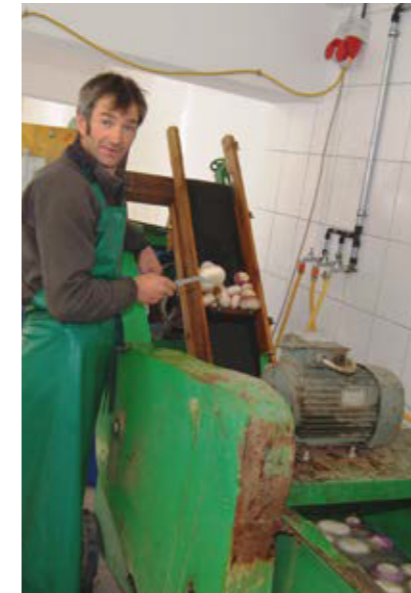
In der Apfelwaschanlage werden die Rüben mit Bürsten gewaschen und mit einem Förderband zum Rübenhäckler transportiert. Eine Kontrolle auf die Sauberkeit der Rüben wird laufend durchgeführt. (Assling, Osttirol).

Spaß und heitere Spiele gehörten früher nicht nur zu den Festen, sondern auch zu den gemeinschaftlich ausgeführten Arbeiten, die oft gemeinsam mit „Nachbarsleuten“ durchgeführt wurden. Es wurde miteinander geredet,