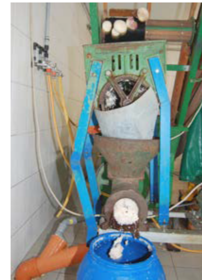
Die gewaschenen Rüben werden in einem Rübenhäckler grob zerkleinert, im Anschluss daran mit einem großen Fleischwolf faschiert und in Fässer abgefüllt (Assling, Osttirol). Bildarchiv Brigitte Vogl-Lukasser, 2010.