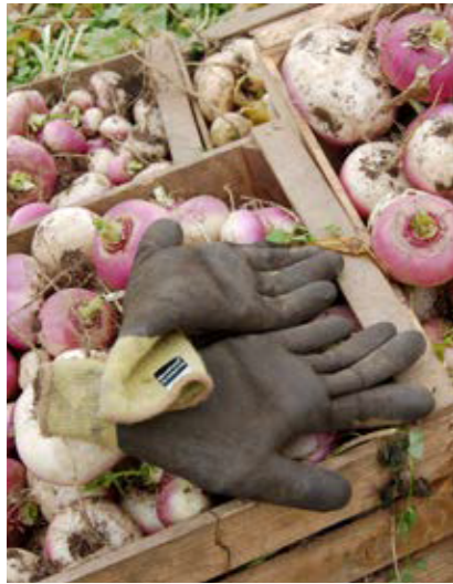
Geerntete Speiserüben, von denen die Blätter entfernt wurden (Assling, Osttirol).

haltbar seien. Mehrfach wird erwähnt, dass bei der Ernte der „Samenrüben“ auf den Mond geachtet werden soll, wobei hier „ abnehmender “ aber auch „ zunehmender Schein “ genannt wurden.