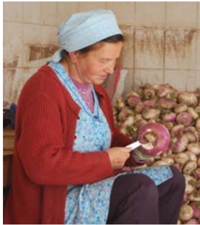
Die Rüben werden händisch geputzt. Dabei werden die Wurzel, der Blattgrund bzw. Blattstiel und wurmstichige Bereiche großflächig mit einem Messer entfernt (Assling, Osttirol).