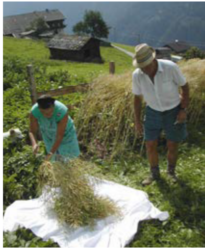
Die Schoten werden auf ein Leintuch gelegt und für den Transport vorbereitet (Assling, Osttirol).