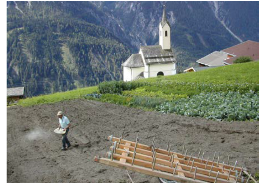
Gesät wird ein Gemenge aus Sand und Saatgut mit der Hand (Assling, Osttirol).

Unkraut wurde kaum bekämpft. Begründet hat man dies damit, dass die Pflanzen bei einem gut vorbereiteten, gut gedüngten Acker („Wenn er wiache isch“), so schnell und vor allem dicht wüchsen, dass das Unkraut gar