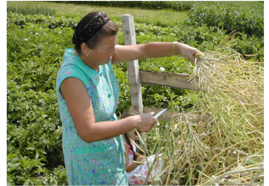
Die Ernte der Schoten erfolgt händisch (Assling, Osttirol). Bildarchiv Christian R. Vogl, 2002.

Im Jahr 2005 haben drei der GesprächspartnerInnen die Speiserübe auf