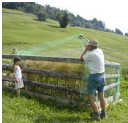
Nach dem Ablühen der Speiserübe, die zur Saatgutgewinnung angebaut wurden („Samenrüben“), wird der eingezäunte Bereich mit einem Vogelschutznetz abgedeckt (Assling, Osttirol).

einigen GesprächspartnerInnen noch im gleichen Jahr wieder ausgesät. An jenen Standorten, an denen das Saatgut rechtzeitig genug ausreift, um es im gleichen Sommer auszusäen, behielt man sich oft größere Reserven zurück, denn schlechte „Samenrüben“ oder ungünstige Witterungsverhältnisse konnten die Reife verzögern. Das aufbewahrte Saatgut wurde dann bei einigen GesprächspartnerInnen mit dem neuen Saatgut vermengt („ dei oltn Suum tu I dazui “).