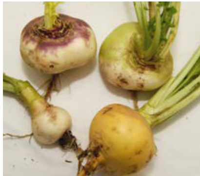
Verschiedenste Sorten der Speiserübe: links oben die lokale Sorte „Asslinger Herbstrübe“; rechts oben die Sorte „Platte Witte Mei“; links unten die Sorte „Snowball“; rechts unten die Sorte „Petrowski“ (die drei zuletzt genannten Sorten sind Mairüben). Bildarchiv Brigitte Vogl-Lukasser, 2018.