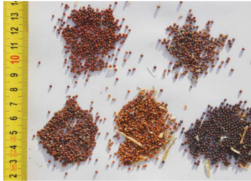
Saatgut mehrerer Herkünfte lokaler Speiserüben.