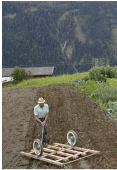
Nach erfolgter Aussaat wird das Saatgut mit der Egge oberflächlich eingearbeitet (Assling, Osttirol).

(„... bolds Laab braun isch ... “). Mehrfach wurde erwähnt, dass die Speiserübe vor dem ersten Frost und bei trockenem Wetter geerntet wird. Die Speiserübe ist laut Aussagen der GesprächspartnerInnen zwar frosttolerant, aber der Geschmack und die Konsistenz der Speiserübe ändern sich, wenn sie einem Frost ausgesetzt war („ Noch dem ersten Frost schmecken sie nimma sou guat “ „ Sonst wearn se wassrig “). Außerdem wird die händische Ernte erschwert, da die Blätter, an denen die Rüben herausgezogen werden, erfrieren und zum Teil abfallen. In Bezug auf den Frost wurde auch berichtet, dass die Rüben bis Allerheiligen (als Lostag) geerntet sein sollen. Wenn die Rüben eingelagert werden, dann soll nach Möglichkeit bei „ abnehmendem Mond “ (dies wird Aussaat- und Erntekalendern entnommen, die die GesprächspartnerInnen nutzen) geerntet werden. Dies geschieht aber auch je nach verfügbarer Zeit.