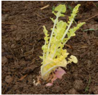
Die überwinterten Samenrüben werden beim Auspflanzen tiefgesetzt, um die Standfestigkeit zu erhöhen. Bildarchiv Brigitte Vogl-Lukasser, 2005.